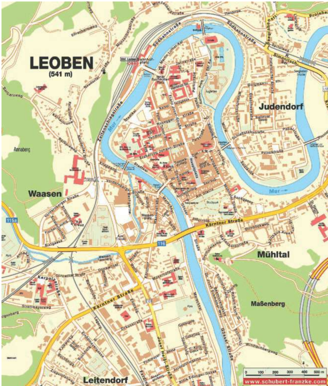
Abb. 5: Stadtplan von Leoben 2018

belastete Personen aus dem kollektiven Gedächtnis nicht verschwinden, sondern sich die Menschen mit ihrer – einer freien und demokratischen Gesellschaft abträglichen – Biografie auseinandersetzen“. 55