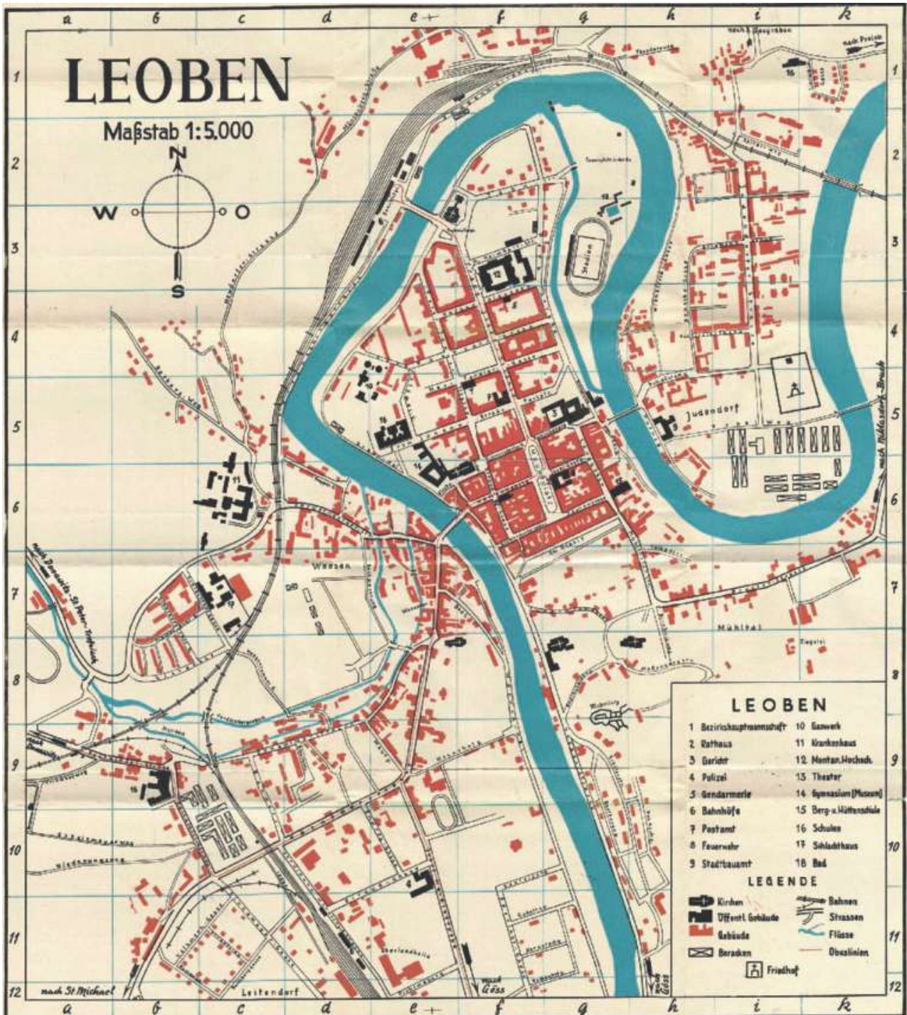
Abb. 4: Stadtplan von Leoben 1954 44