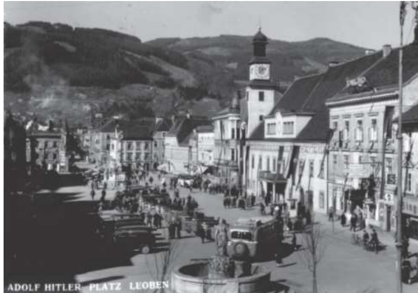
Abb. 3: Umbenennung des Hauptplatzes in Adolf Hitler-Platz 30

Am 19. April 1938 sah sich Landrat Dr. Willi Kadletz 31 veranlasst, ein vertrauliches Schreiben über die Benennung von Strassen und Plätzen nach dem Führer an alle Bürgermeister zu versenden. Darin wurde zunächst festgehalten, dass vor der Umbenennung in jedem einzelnen Falle festgestellt wird, ob alte, gute Traditionen verletzt werden oder nicht , denn nur dann könnten Genehmigungsgesuche positiv erledigt werden. Nicht zu genehmigen ist z. B. die Umbenennung einer Kaiser-Joseph-Strasse; dagegen bestehen gegen die Umbenennung einer Kaiser-Karl-Strasse oder einer Dollfuß-Strasse keine Bedenken. Der Leobener Bürgermeister meldete daraufhin die vollzogene Umbenennung des Hauptplatzes, und auch die Marktgemeinde Göß teilte am folgenden Tag mit, dass die dortige Dollfußstraße in Adolf-Hitler-Straße umbenannt und die neuen Straßen- und Hausnummerntafeln bereits angebracht seien. Am 8. Mai folgte ein weiteres Schreiben des Bezirkshauptmannes auf neuerlichem Auftrag der Landeshauptmannschaft für Steiermark an die Stadt Leoben, die Märkte Göß und Eisenerz sowie die Gemeinden Niklasdorf und Kraubath (also an Orte mit gemeldeten Benennungen nach Adolf Hitler), worin er die Einladung ausspricht, eingehend darüber zu berichten, ob tatsächlich keine alte, gute Tradition verletzt wird. 32