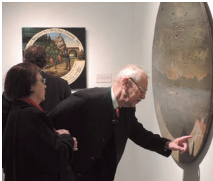
Reges Interesse an den historischen Schützenscheiben der Stadt Leoben

In der Kunsthalle Leoben wurde kürzlich die Schützenscheiben-Ausstellung mit zahlreichen sehenswerten Objekten aus dem Museumsdepot Leoben eröffnet.