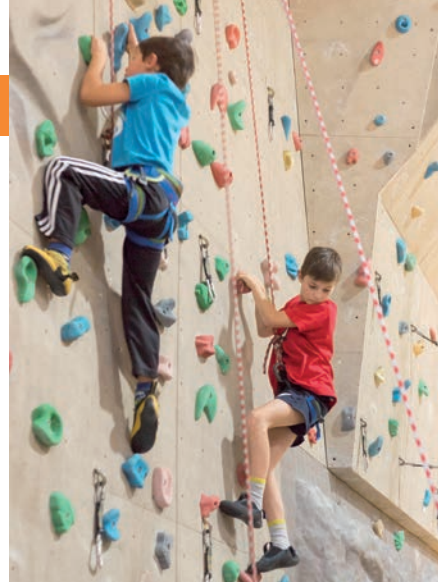
Klettern ist eine sehr beliebte Sportaktivität für Kinder.

Infos. Der Kurs zählt auch als Vorbereitung zu den großen Ski und Snowbaordkursen der Naturfreunde Leoben, die im Dezember starten. Alle Infos und Fotos der Kletterkurse sowie Anmeldeinfos für die Skikurse unter www.naturfreunde-leoben.at bzw. Tel. 0676/9507386“