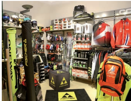
Ein Blick auf das große Sortiment von CCI im LCS Leoben