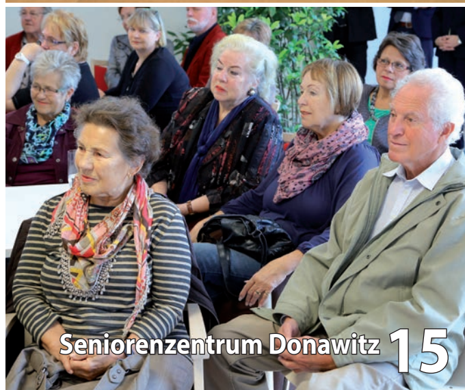
Seniorenzentrum Donawitz 15