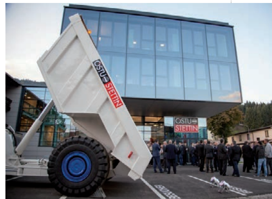
Das erweiterte Gebäude von ÖSTU-Stettin an der Münzenbergstraße ist mit seiner Glasfassade ein wahrer „Hingucker“.

Geschichte. Bereits 1911 wurde das Schacht- und Tunnelbauunternehmen ÖSTU in der Obersteiermark gegründet. 1995 fusionierte ÖSTU mit Stettin, dem Spezialisten für Hoch- und Tiefbau. Seit 2008 ist das traditionsreiche Unternehmen nun Teil