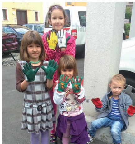
Öko-Kids vom Umweltfest Judendorf

Nach der Eröffnung durch den Kindergarten Judendorf wurde beim Entleeren einer Restmülltonne gezeigt, was fälschlicherweise in dieser gelandet ist. Um dies in Zukunft bestmöglich verhindern zu können, wurden mehrsprachige Broschüren über richtige Mülltrennung verteilt. Auch Magier Renaldo machte auf seine Art auf den richtigen Umgang mit Müll aufmerksam.