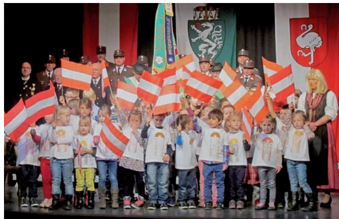
Auch die Kinder des Kindergartens Leoben-Donawitz hatten Programmpunkte vorbereitet.