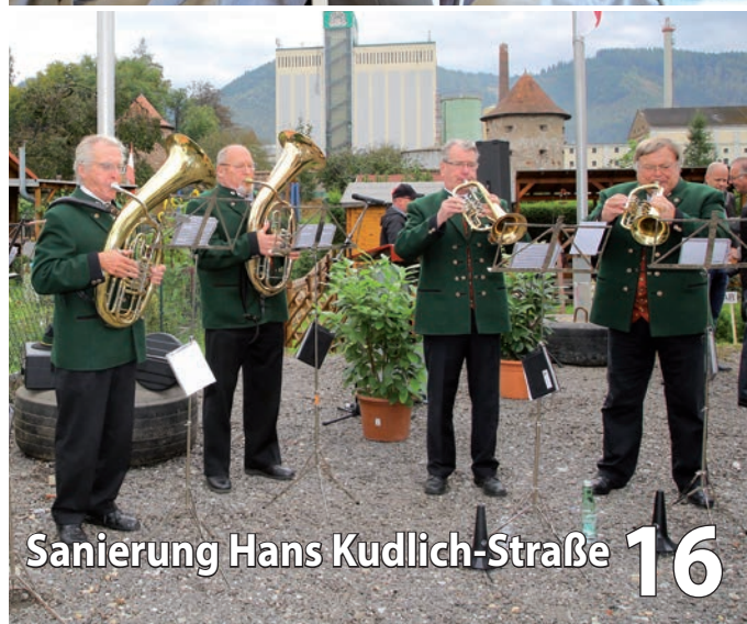
Sanierung Hans Kudlich-Straße 16