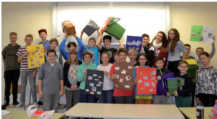
Schüler als Vorbilder in Sachen Mülltrennung