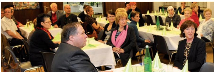
Auch heuer wird sich die Stadt Leoben mit einem Festakt bei ehrenamtlichen Mitarbeitern bedanken – sie leisten einen großen Beitrag zu einem besseren Miteinander.

bei ehrenamtlichen Mitarbeitern bedanken – der Stadtrat fasste den entsprechenden Beschluss. Außerdem werden wiederum die Weihnachtsfeiern der Stadt Leoben für die älteren Menschen durchgeführt, welche 35.000 Euro kosten.