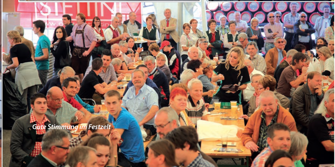
Gute Stimmung im Festzelt