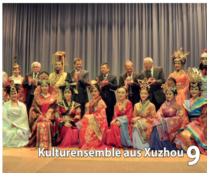
Kulturensemble aus Xuzhou 9