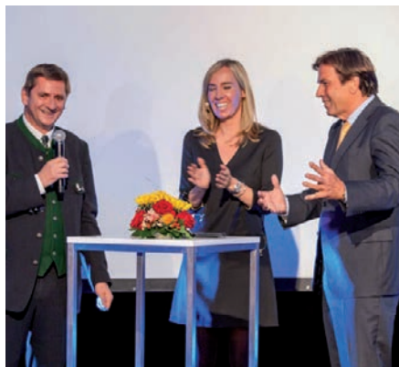
Landeshauptmann Franz Voves (r.) und Bürgermeister Kurt Wallner (l.) im Eröffnungs-Interview mit ORF-Frau Naja Bernhard

Eröffnung. Die neue Unternehmenszentrale am Hauptstandort Leoben soll aber auch ein Symbol für die Modernität und Stärke von ÖSTU-Stettin sein. Die großzügigen Glasflächen stehen für Transparenz und Offenheit, Werte, in diesem Unternehmen groß geschrieben werden. Die feierliche Eröffnung und Einweihung fand am 2. Oktober statt. Im Interview mit ORF-Anchorfrau Naja Bernhard hoben Landeshauptmann Franz Voves und der Bürgermeister von Leoben, Kurt Wallner, die seit Jahrzehnten bestehende, wirtschaftliche Relevanz des Standorts für die Region hervor.