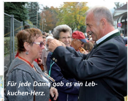
Für jede Dame gab es ein Lebkuchen-Herz.