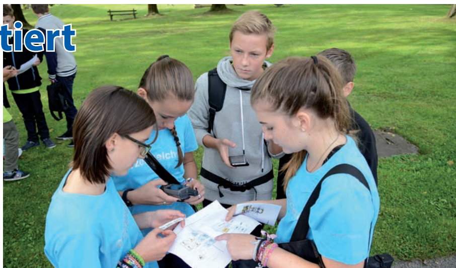
Schüler der NMS beim eifrigen „Hightech-Cachen“ in Leoben-Donawitz

Beteiligung. Durchgeführt wurde dieses Projekt mit einer vierten Klasse der NMS Leoben-Stadt. Die Schüler mussten insgesamt sechs Stationen innerhalb Leobens ausfindig machen, dort die jeweiligen Aufgaben lösen und damit die erforderlichen GPS-Koordinaten eruieren. Während in der Stahlstraße etwa der Produktionsprozess der voestalpine vom Rohstoff Erz bis zum Endprodukt in Form der Schiene in die richtige Reihenfolge gebracht werden musste, konnten sich die Jugendlichen bei der Pfarrkirche Donawitz kreativ austoben. Dort