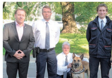
Die Stadtstreife Leoben wird fortgesetzt – die Situation in der Innenstadt hat sich bereits deutlich verbessert.

Soziales. Die Stadt Leoben wird sich weiters wieder mit einer Festveranstaltung